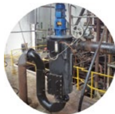
Sistemas de Emulsión y Microemulsión