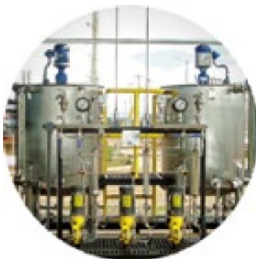
Sistemas de Preparación

Novatec Fluid System S.A. asesora, diseña y ensambla soluciones integrales a medida para aplicaciones de agitación y mezcla que se adaptan a diferentes procesos de la industria. Se entregan unidades paquetizadas que incluyen tanques (depósitos de mezcla), equipos para la dosificación del producto, instrumentación y accesorios de control.